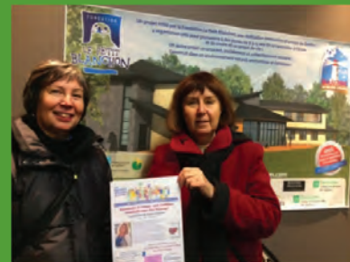
Deux organisatrices des Bontés divines de Québec

Pour suivre les activités offertes : https://www.facebook.com/bontesdivines/