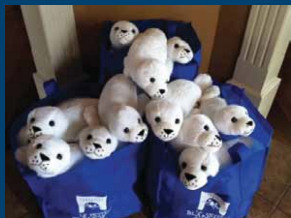
Mme Plante avait acheté à la fin de l'été les toutous blanchons pour la classe de sa fille à l'école Prés-Verts