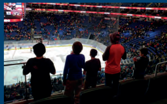
Les enfants suivent attentivement le déroulement de l'action !